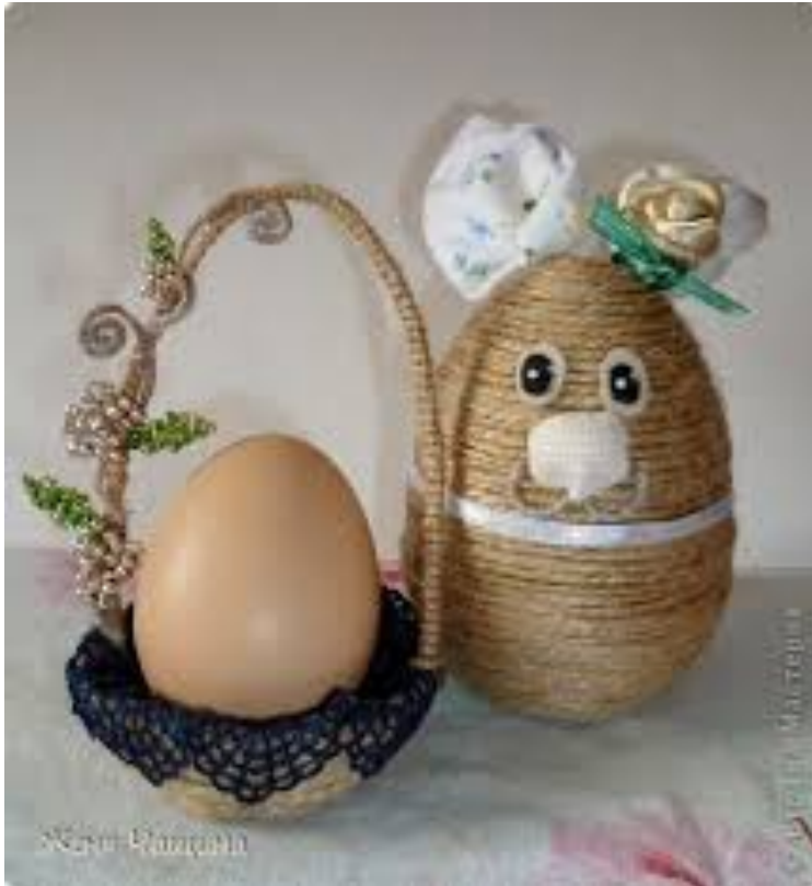
Posodica je iz odpadne plastične embalaže ovita z vrvico.