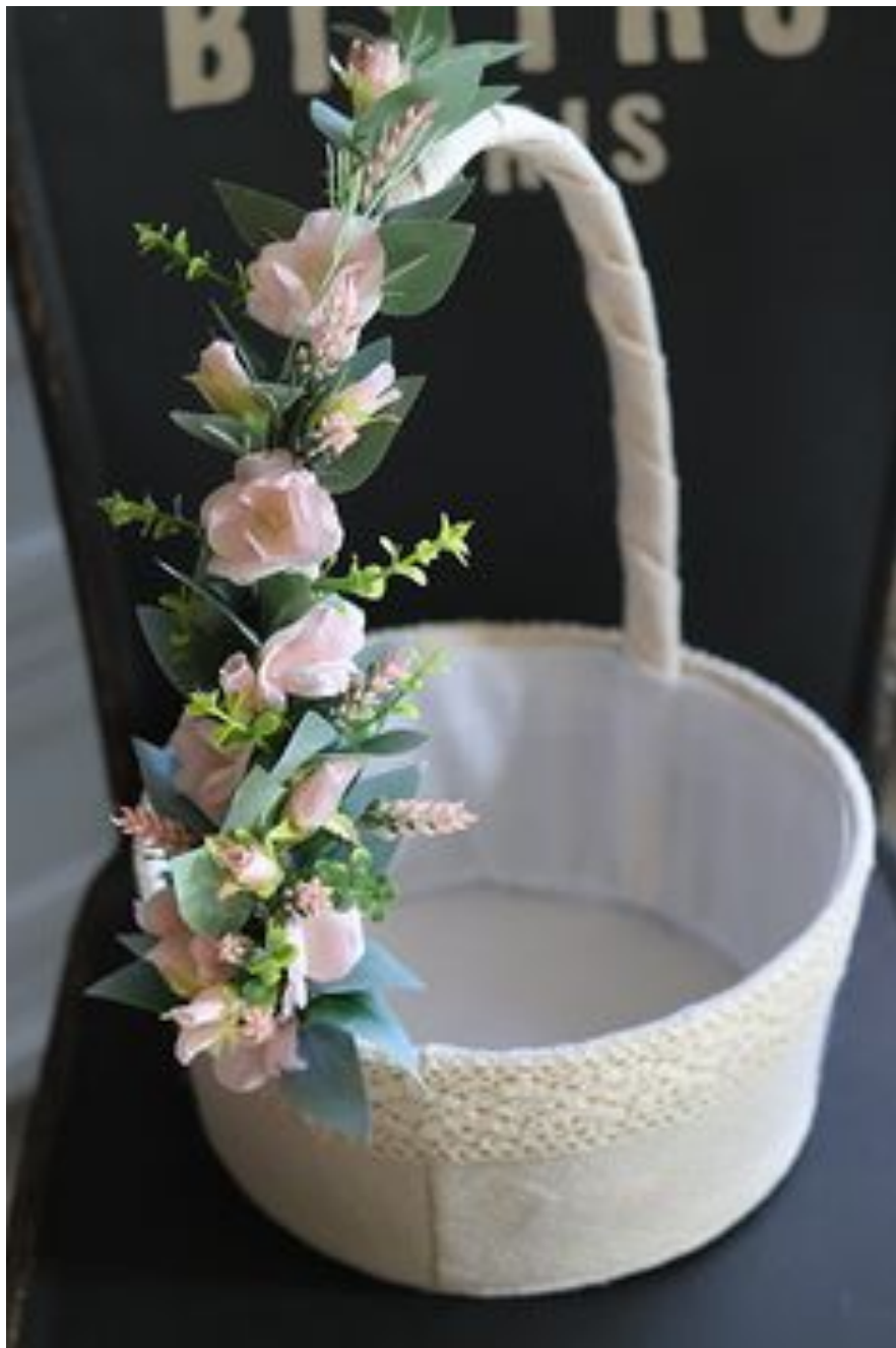
Košarica za ....