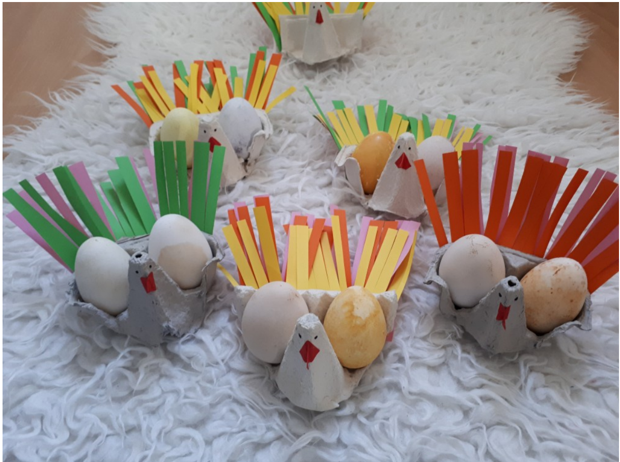
Kokoši iz jajčnih kartonov