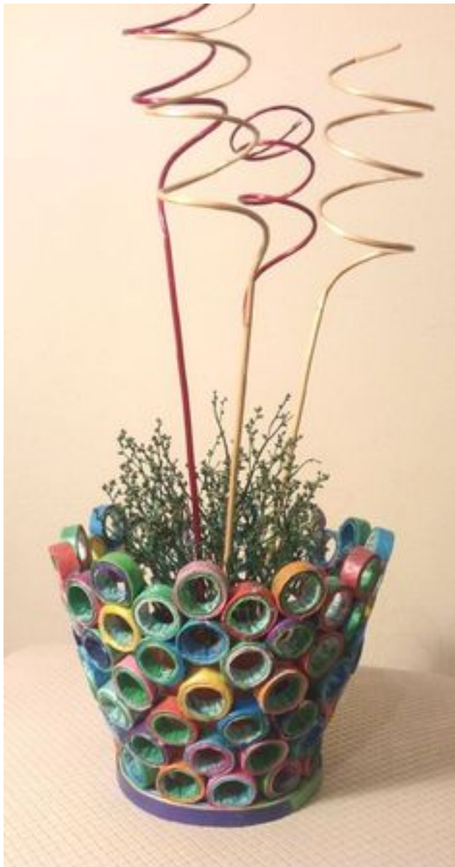
Zanimiva namizna dekoracija...