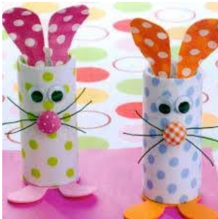
Tulec je iz plastenke. Tudi dodatki so lahko iz plastenk.