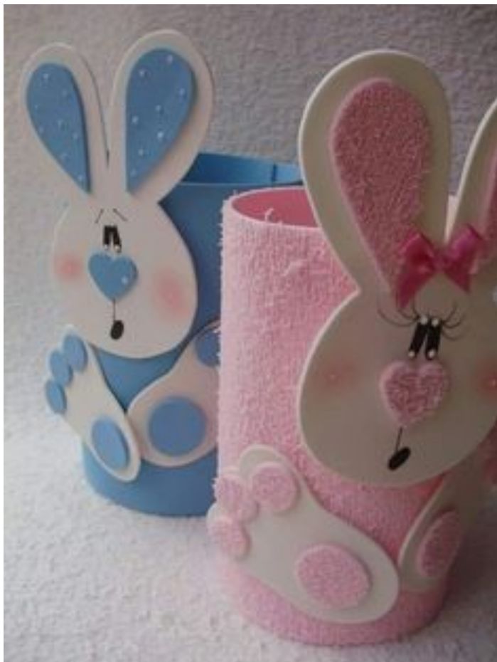
Posodica iz plastenke ovita v odpadno blago,...dekoracija so lahko gumbki, perlice, ostanki blaga,...