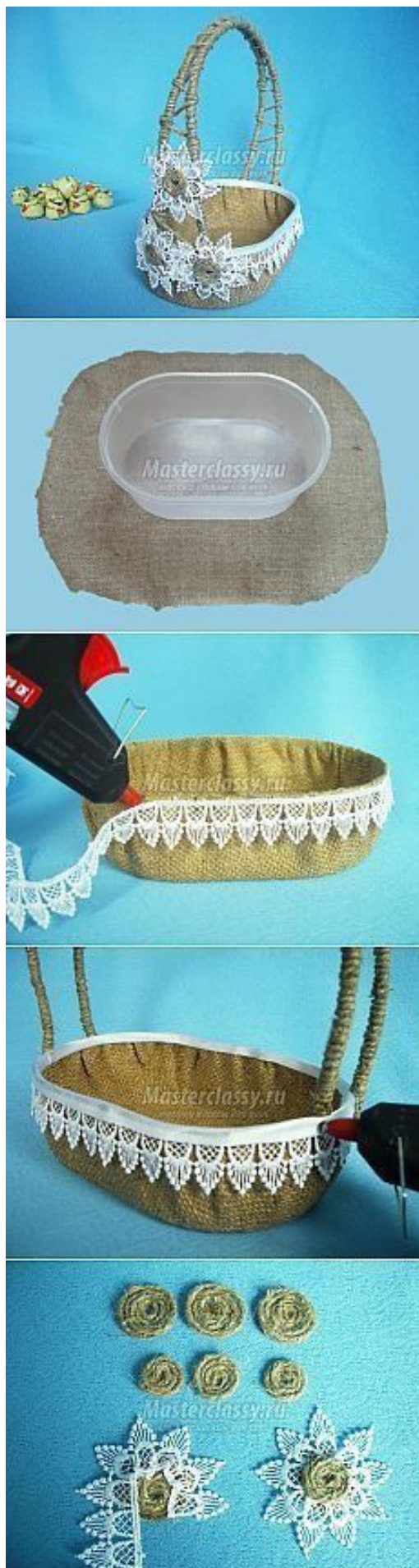
Odlična mini košarica iz odpadne plastenke,... z dekorativnimi dodatki