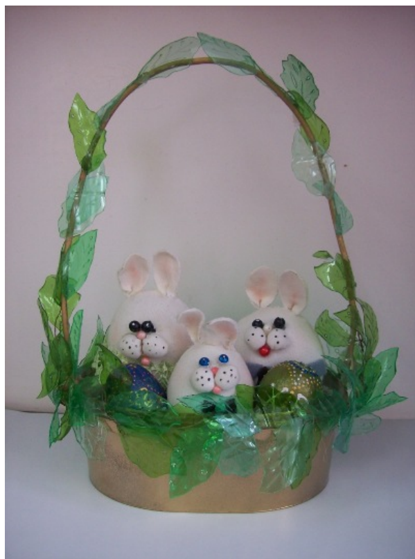
Košarica iz odpadne lepenke, dekoracija iz odpadne plastenke