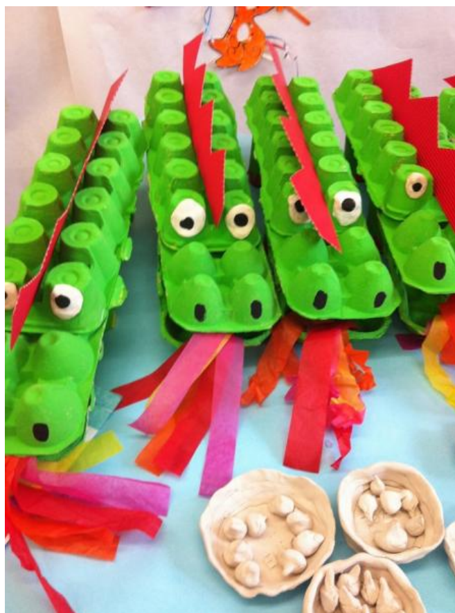
Krokodili iz jajčnih kartonov